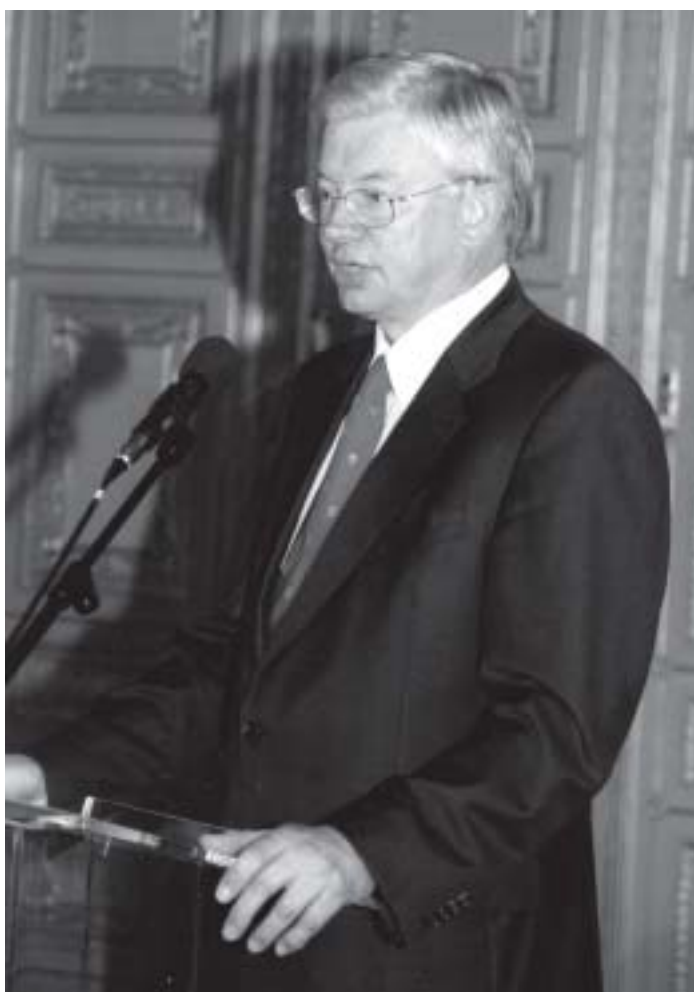
Der Hessische Ministerpräsident Roland Koch bezeichnete die Arbeit des „fact finders“ Blix als eine bedeutende Voraussetzung für die Friedenssicherung.

Diese Analyse, die Fähigkeit, das offen zu legen und damit umzugehen hat zwei wichtige Dimensionen: zum einen ist in einer Situation, in der jedes Land, das über solche Mittel verfügt, potenziell andere Länder bedrohen kann, ist Transparenz das Einzige, das die Grundlagen für friedenssichernde Maßnahmen überhaupt schaffen kann. Friedensverabredungen mit jemand, von dessen Potenzialen man nichts weiß und man befürchtet, dass er Dinge verheimlicht, die schlimmer sind als alles, über das er verhandelt, sind nicht möglich. Und der zweite Aspekt ist die Voraussetzung dafür, friedliche Verhältnisse auf der Welt zu erhalten. Sie hängt davon ab, dass die Staatengemeinschaft in die Lage versetzt wird,