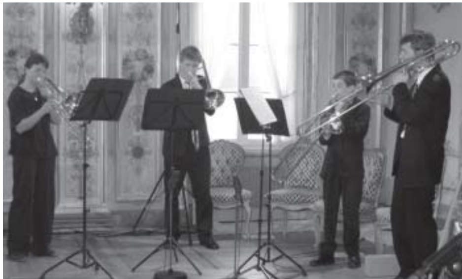
Das Posaunenquartett der Wiesbadener Musikakademie umrahmte den Festakt mit einem traditionellen Lied von Mogens Andresen („Den Blomstertid nu kommer“), einer Intrade aus „Banchetto musicale“ von Johann Hermann Schein und der „Suite quatuor pour 4 Trombones“ von Flor Peeters.

Bis zum Mai 2003 hatten die Besatzungsmächte bereits zahlreiche irakische Wissenschaftler, Militärs und Techniker befragt und Belohnungen für Informationen über Waffenlager ausgesetzt. Die Befragten gaben entweder an, dass sie nichts über Waffenla-