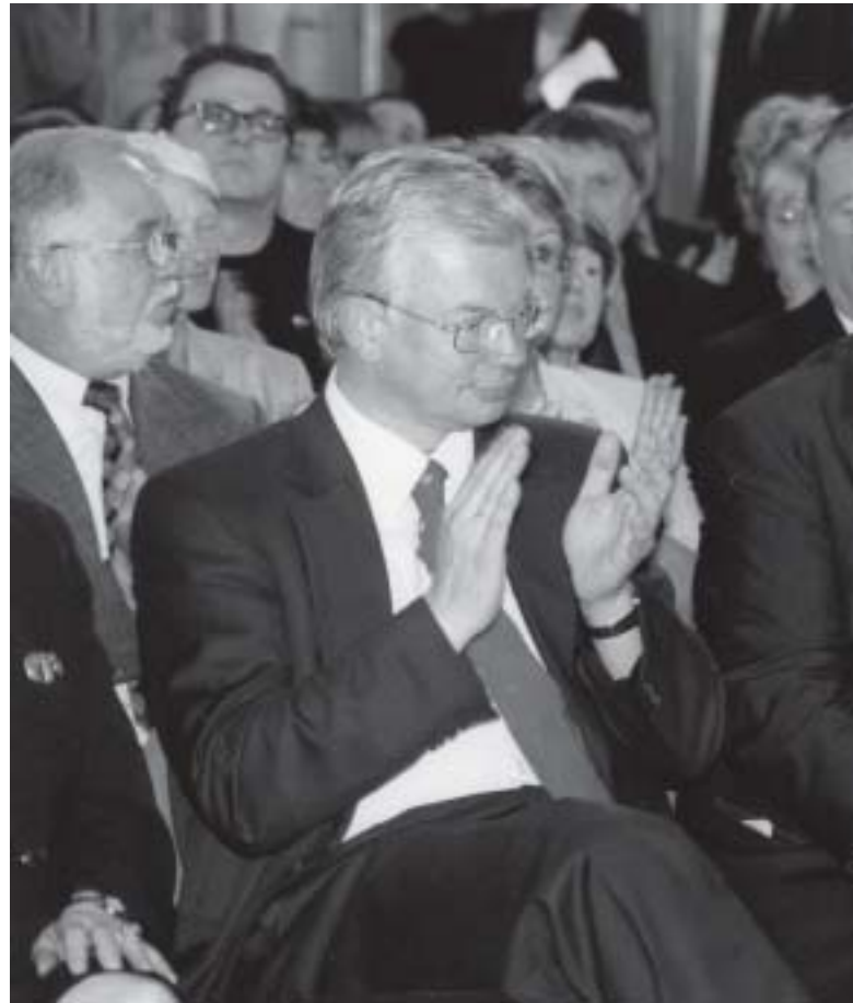
Hans Blix nach der Überreichung der Urkunde zusammen mit dem Hessischen Ministerpräsidenten Roland Koch.

Blix bestand erfolgreich auf der Zerstörung der Al Samoud-Raketen, welche die erlaubte Reichweite überschritten – der erste irakische Abrüstungsschritt seit Jahren. Er