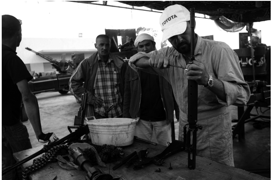
Ungleicher Kampf: Dank europäischer Hilfe sind die libyschen Regierungstruppen bestens ausgerüstet. Besser ausgebildet sind sie sowieso. Um gegen Gaddafis hoch gerüstete Soldaten standhalten zu können, wurden in Misurata während der Belagerung unermüdlich Waffen repariert, umgebaut, erbeutete Waffen wurden umgerüstet oder zu neuen gebastelt so wie hier im Bild auf einem Schulhof in Misurata.

Entscheidungen über Rüstungsexporte liegen in der EU immer noch bei den einzelnen Ländern. Es existiert zwar ein EU-Verhaltenskodex über Rüstungsausfuhr, der bleibt aber in letzter Konsequenz doch ein Papiertiger. Caroline Fehll fordert eine europäische Rüstungsexportpolitik, die nicht von nationalen Egoismen bestimmt wird und präsentiert einige realisierbare Ideen, wie sie verwirklicht werden könnte. Karin Hammer