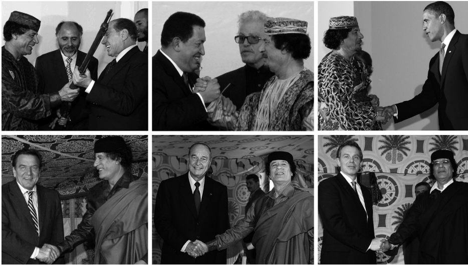
Nachdem Gaddafi offiziell dem Terrorismus und den Waffenvernichtungswaffen abgeschworen hatte, wurde er bereitwillig im Kreis „der Guten“ aufgenommen: vom italienischen Ministerpräsidenten Silvio Berlusconi (hier 2002 schon vor seiner Kehrtwende), vom venezolanischen Staatschef Hugo Chávez (2009), US-Präsidenten Barack Obama (2009), vom ehemaligen Bundeskanzler Gerhard Schröder (2004), vom ehemaligen französischen Präsidenten Jacques Chirac (2004) und dem ehemaligen britischen Premier Tony Blair (2004).

Waffenlieferungen an den mit einem VN-Embargo belegten Sudan zeigen. Hinzu kommt, dass eine Armee privater Waffenhändler stets bereit ist, staatliche Lieferausfälle zu kompensieren. Ein Embargo steigert sogar noch die Profite, die sich auf dem illegalen Schwarzmarkt mit Waffen erzielen lassen – dies gilt insbesondere für Klein- und Leichtwaffen, die der staatlichen Kontrolle viel leichter zu entziehen sind als militärisches Großgerät. Diese illegalen Waffenströme lassen sich auch mit großem Aufwand nicht abstellen, sondern allenfalls erschweren und reduzieren. Doch schon das erfordert engmaschige und damit teure Kontrollen.